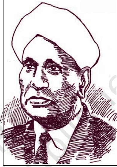
सर चंद्रशेखर वेंकट रामन्

रामन् का मस्तिष्क विज्ञान के रहस्यों को सुलझाने के लिए बचपन से ही बेचैन रहता था। अपने कॉलेज के जमाने से ही उन्होंने शोधकार्यों में दिलचस्पी लेना शुरू कर दिया था। उनका पहला शोधपत्र फिलॉसॉफिकल मैगजीन में प्रकाशित हुआ था। उनकी दिली इच्छा तो यही थी कि वे अपना सारा जीवन शोधकार्यों को ही समर्पित कर दें, मगर उन दिनों शोधकार्य को पूरे समय के कैरियर के रूप में अपनाने की कोई खास व्यवस्था नहीं थी। प्रतिभावान छात्र सरकारी नौकरी की ओर आकर्षित होते थे। रामन् भी अपने समय के अन्य सुयोग्य छात्रों की भाँति भारत सरकार के वित्त-विभाग में अफसर बन गए। उनकी तैनाती कलकत्ता* में हुई।